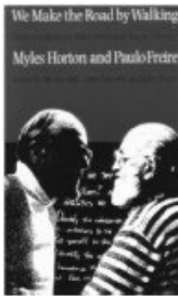
We make the road by walking